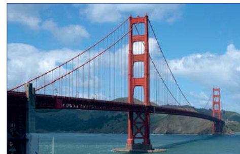
San Francisco, Golden Gate Bridge

Brücke, über die Sie nach Sausalito gelangen. Der Nachmittag steht zur freien Verfügung. Die Stadt lässt sich, trotz der Hügel, leicht zu Fuss oder mit den Cable Cars erkunden. Auch zum Einkaufen lockt diese Stadt. F