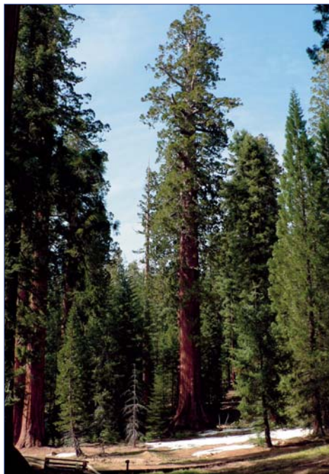
Riesenmammutbäume im Yosemite Nationalpark

10. Tag: MODESTO – SAN FRANCISCO (143 km) Frühe Abfahrt in Richtung San Francisco. Geführte Stadtrundfahrt durch San Francisco, eine der meist gefilmten und fotografierten Städte der Welt. Die Stadt ist ein bunter Mix aus Kulturen, Farben und Geschichte mit zahlreichen Sehenswürdigkeiten, wie z.B. das Viertel Fisherman's Wharf mit seinen Cafés, Kneipen und Restaurants. Die Pier 39, ein Teil von Fisherman's Wharf, ist ein ganzjähriger Rummel mit Souvenir-Läden, Fahrgeschäften und Restaurants. Während der Stadtrundfahrt sehen Sie den Financial District (Transamerica Pyramid), Union Square, Chinatown und natürlich die weltbekannte Golden Gate