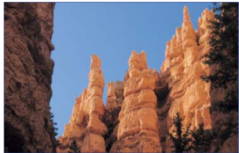
„Hoodoos“ im Bryce Canyon

4. Tag: LAUGHLIN – GRAND CANYON (330 km) Am Morgen Abfahrt zum Grand Canyon, sicher ein Höhepunkt Ihrer Tour. Der atemberaubende Grand Canyon ist etwa 450 km lang (davon liegen 350 km innerhalb des Nationalparks), zwischen 6 und 30 km breit und bis zu 1.800 m tief. Der Name des Canyons stammt vom Colorado River, der früher in Teilen Grand River genannt wurde. Spaziergang entlang des Südrands von dessen Aussichtspunkten Sie die grenzenlose Weite des Grand Canyons überblicken können. Möglichkeit eines Helikopterfluges über den Grand Canyon ( fakultativ ). F